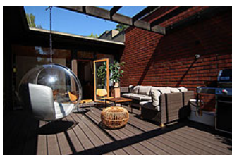
Finnische Sommerfreuden: Mauern bremsen den Wind, UPM ProFi Deck macht die Terrasse fußwarm.